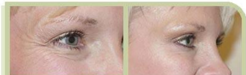
Vor- und nach einer Behandlung

Durch das wiederholte Anspannen der Gesichtsmuskulatur kommt es über die Jahre zu einer dauerhaften Vertiefung der Gesichtsfalten.