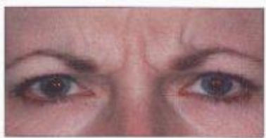
Vor- und nach der Behandlung

Muskeln angespannt wird, kann mit dem Gesicht Freude, Erstaunen, Wut oder Ärger ausgedrückt werden. Gerade die Glabellafalten zwischen den Augenbrauen vermitteln oft den Eindruck des Unmuts. Diese werden daher auch „Zornesfalten“ genannt und es entsteht der so genannte „böse Blick“.